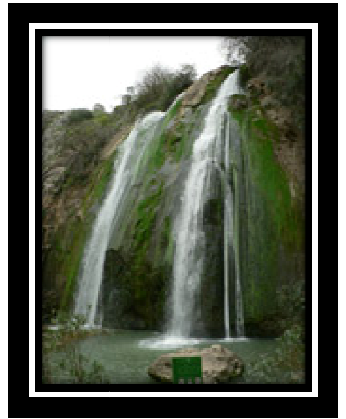
תמונה: מפל התנור.

היום, אנחנו קוברים את ראשינו בחול, ולא מוכנים לראות עד כמה עגום המצב באמת. אולי כי לא מדברים על זה מספיק בחדשות, או כי יש לנו בעיות אחרות לדאוג בגללן, או אולי אנו חושבים שמישהו אחר יפתור את הבעיה הזאת בשבילנו או שהיא תיעלם מעצה ככה סתם פתאום ביום בהיר אחד (או גשום אחד), או אולי כי אנחנו חושבים שאין לנו שום יכולת להשפיע? במקור אני מגיעה מהצפון (מטולה), לכן אני רגילה לראות מגיל אפס ירוק בעיניים, להיות קרובה לנחלים שופעי מים, לכנרת שלנו ולחרמון...היום המצב כל כך שונה! כל כך עצוב.